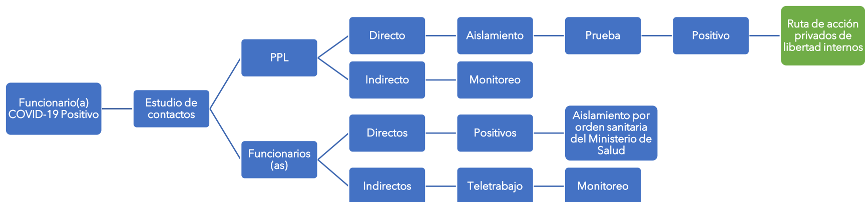
Figura 3. Ruta de acción en caso de personas funcionarias positivas COVID-19