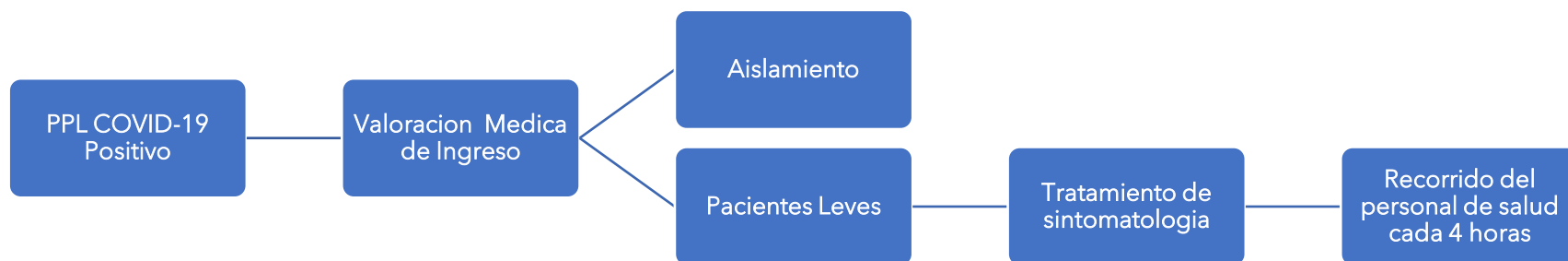
Figura 1. Ruta de acción en caso de personas privadas de libertad COVID-19 positivas de ingreso externo