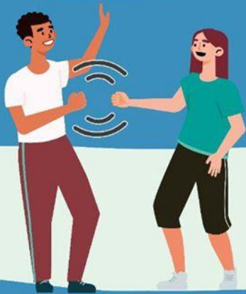
CON EL PUÑO DE LEJOS