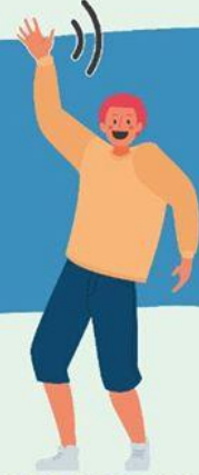
AGITANDO LAS MANOS