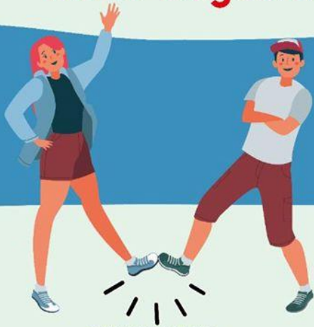
CON EL PIE