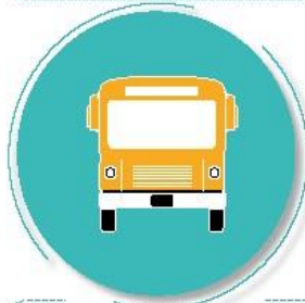
Después de utilizar el transporte público