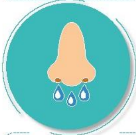
Después de toser o estornudar