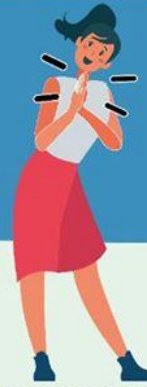
JUNTANDO LAS MANOS