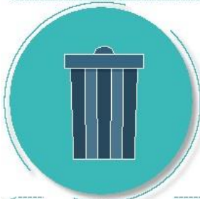
Después de tirar la basura