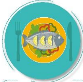
Antes de preparar y comer los alimentos