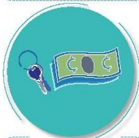
Después de tocar dinero o llaves