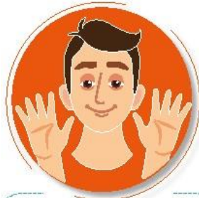
Antes de tocarse la cara