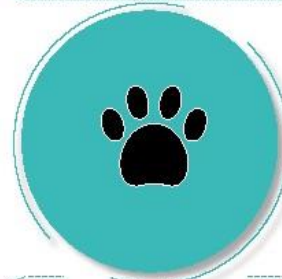
Después de estar con mascotas