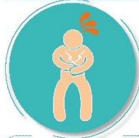
Después de visitar o atender una persona enferma