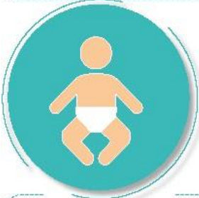
Antes y después de cambiar pañales