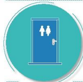
Después de tocar pasamanos o manijas de puertas